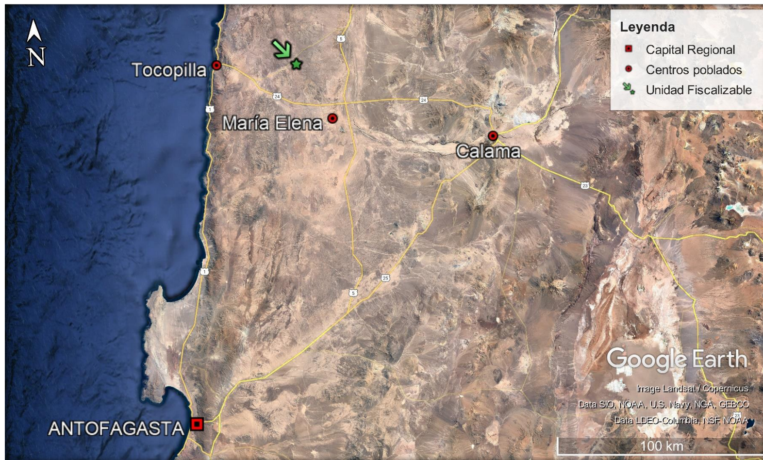
Figura 1. Ubicación Regional UF Mina - Planta Mantos al Sol