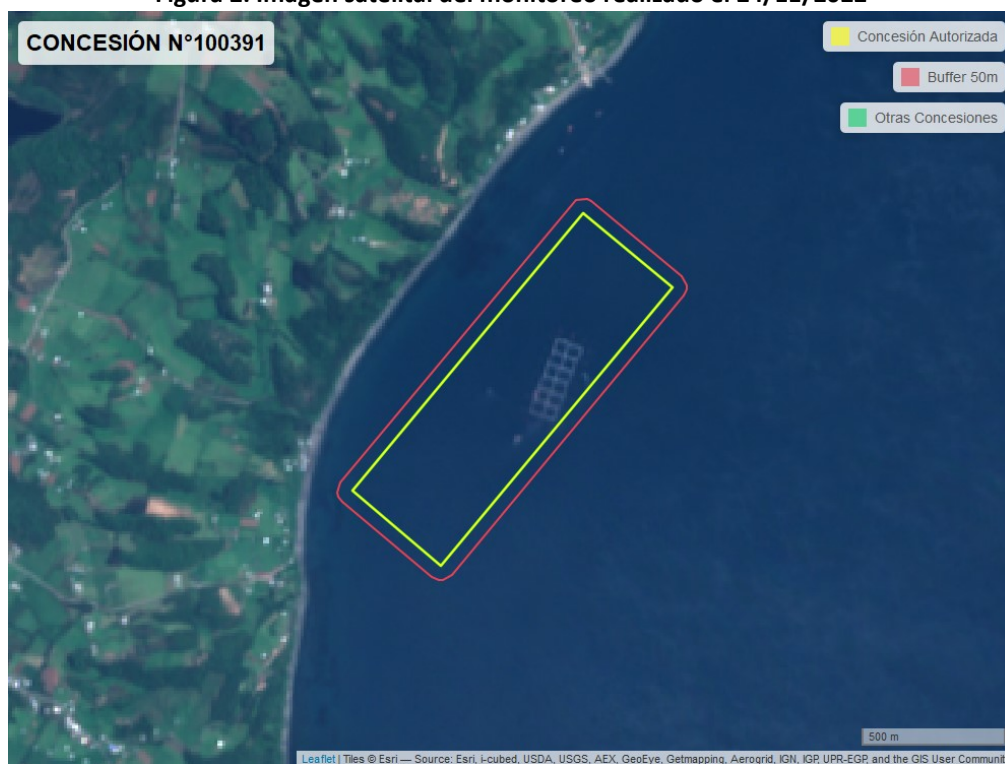
Figura 2. Imagen satelital del monitoreo realizado el 24/11/2022

En las siguientes figuras se muestran las imágenes analizadas para cada periodo y/o fecha: