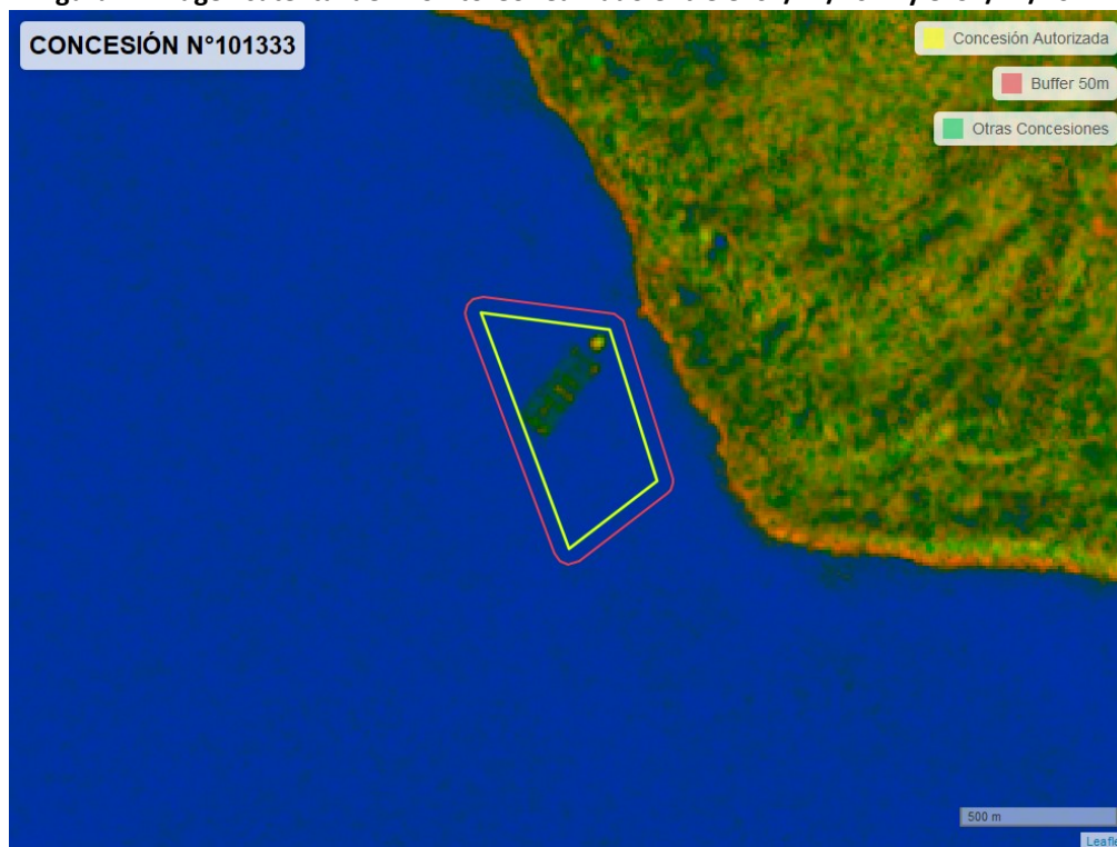
Figura 2. Imagen satelital del monitoreo realizado entre el 01/11/2022 y el 31/12/2022

En las siguientes figuras se muestran las imágenes analizadas para cada periodo y/o fecha: