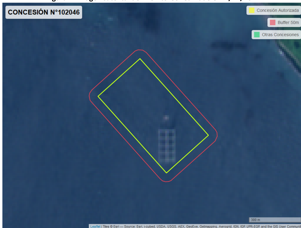
Figura 2. Imagen satelital del monitoreo realizado el 24/12/2022

En las siguientes figuras se muestran las imágenes analizadas para cada periodo y/o fecha: