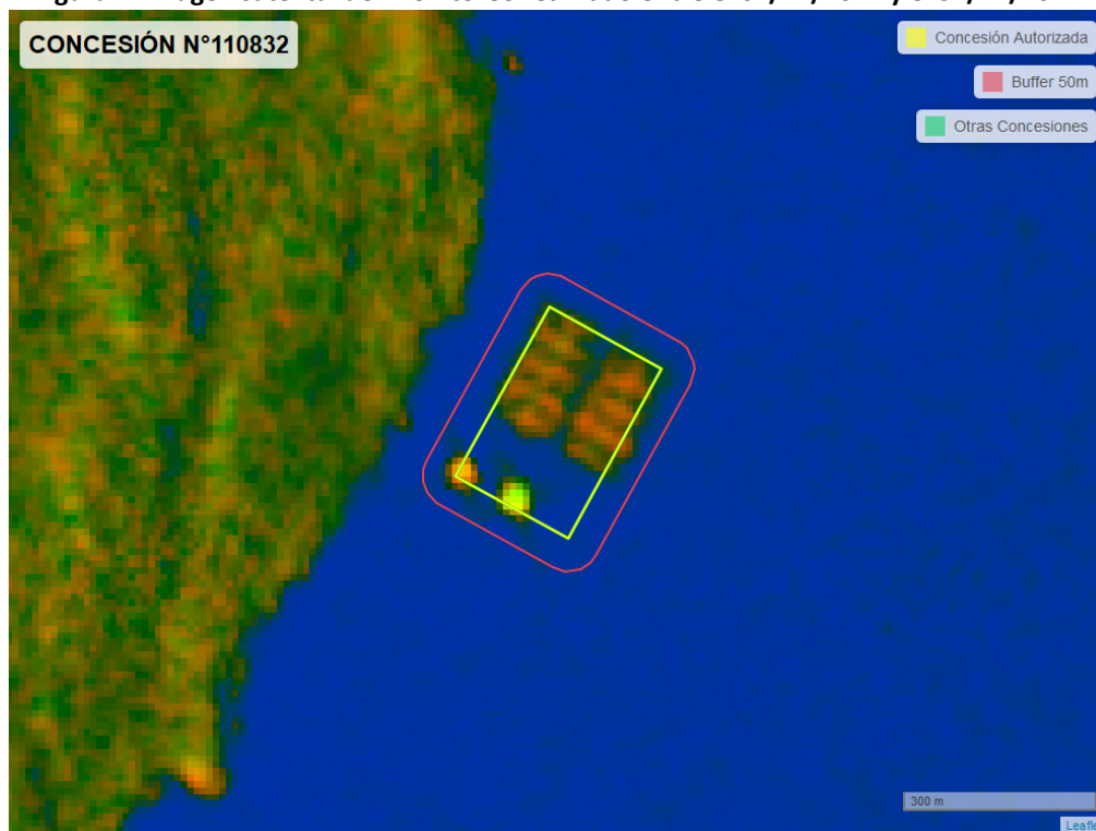
Figura 2. Imagen satelital del monitoreo realizado entre el 01/11/2022 y el 31/12/2022

En las siguientes figuras se muestran las imágenes analizadas para cada periodo y/o fecha: