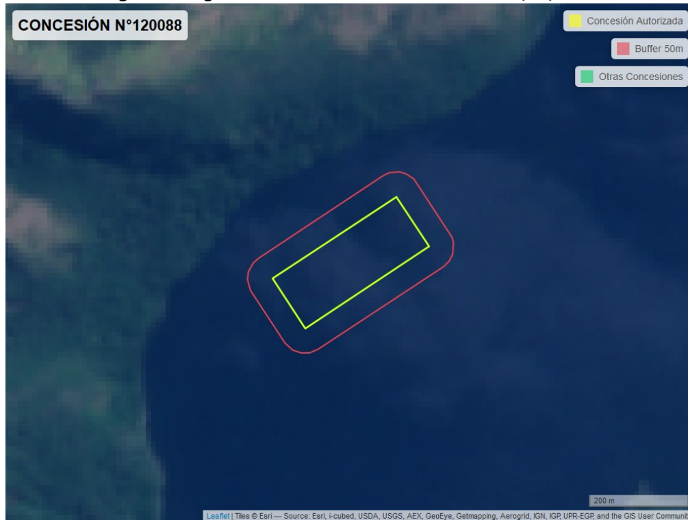
Figura 2. Imagen satelital del monitoreo realizado el 05/11/2022

En las siguientes figuras se muestran las imágenes analizadas para cada periodo y/o fecha: