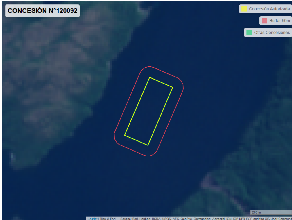
Figura 2. Imagen satelital del monitoreo realizado el 05/11/2022

En las siguientes figuras se muestran las imágenes analizadas para cada periodo y/o fecha: