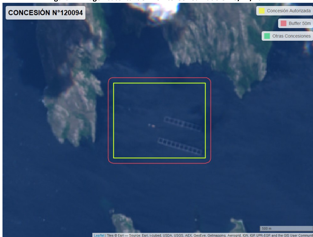
Figura 2. Imagen satelital del monitoreo realizado el 23/12/2022

En las siguientes figuras se muestran las imágenes analizadas para cada periodo y/o fecha: