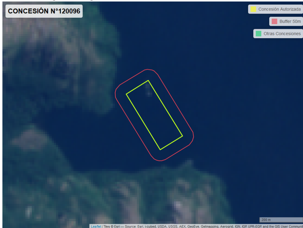
Figura 2. Imagen satelital del monitoreo realizado el 05/11/2022

En las siguientes figuras se muestran las imágenes analizadas para cada periodo y/o fecha: