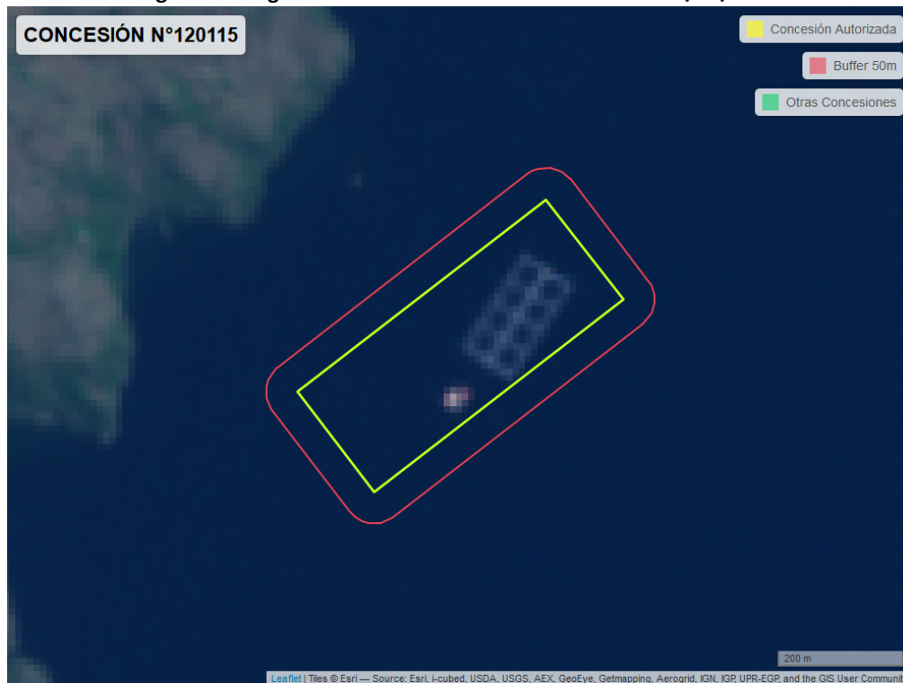
Figura 2. Imagen satelital del monitoreo realizado el 08/12/2022

En las siguientes figuras se muestran las imágenes analizadas para cada periodo y/o fecha: