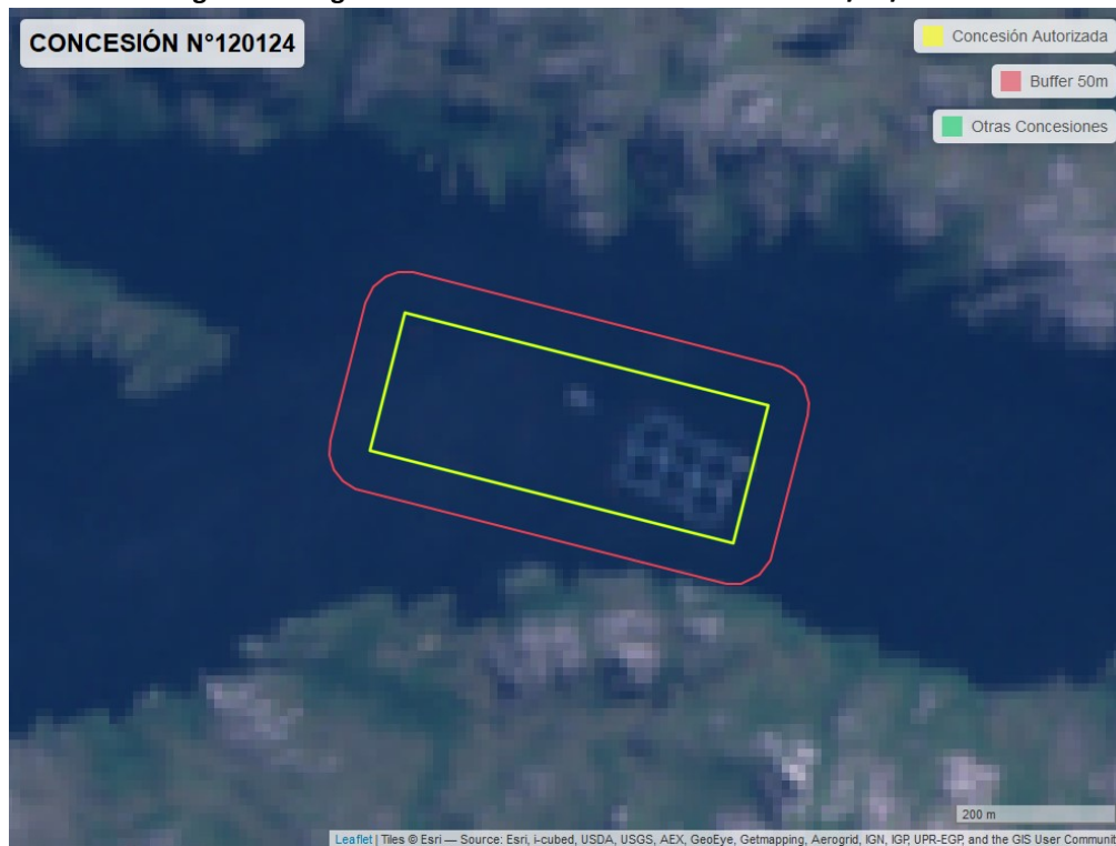
Figura 2. Imagen satelital del monitoreo realizado el 05/11/2022

En las siguientes figuras se muestran las imágenes analizadas para cada periodo y/o fecha: