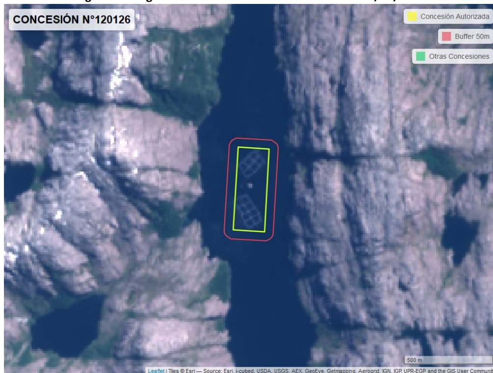
Figura 2. Imagen satelital del monitoreo realizado el 05/11/2022

En las siguientes figuras se muestran las imágenes analizadas para cada periodo y/o fecha: