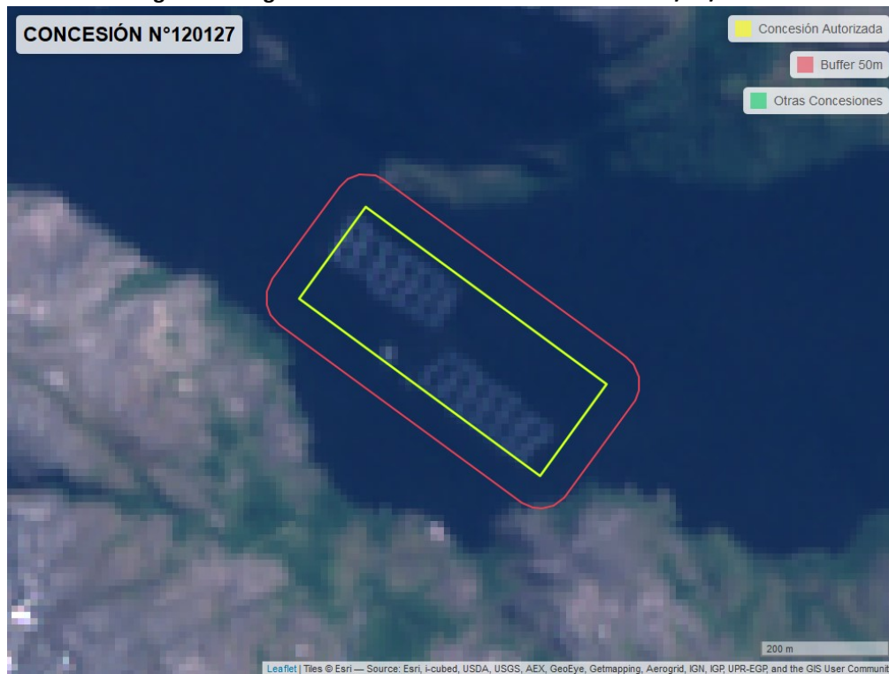
Figura 2. Imagen satelital del monitoreo realizado el 05/11/2022

En las siguientes figuras se muestran las imágenes analizadas para cada periodo y/o fecha: