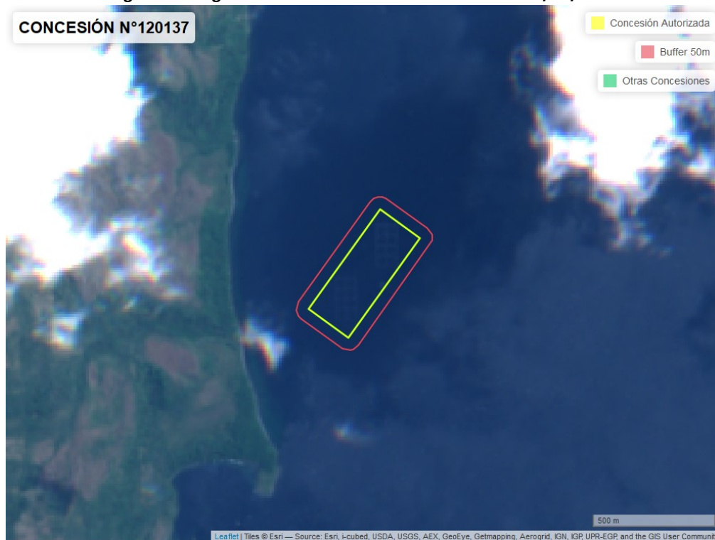
Figura 2. Imagen satelital del monitoreo realizado el 23/12/2022

En las siguientes figuras se muestran las imágenes analizadas para cada periodo y/o fecha: