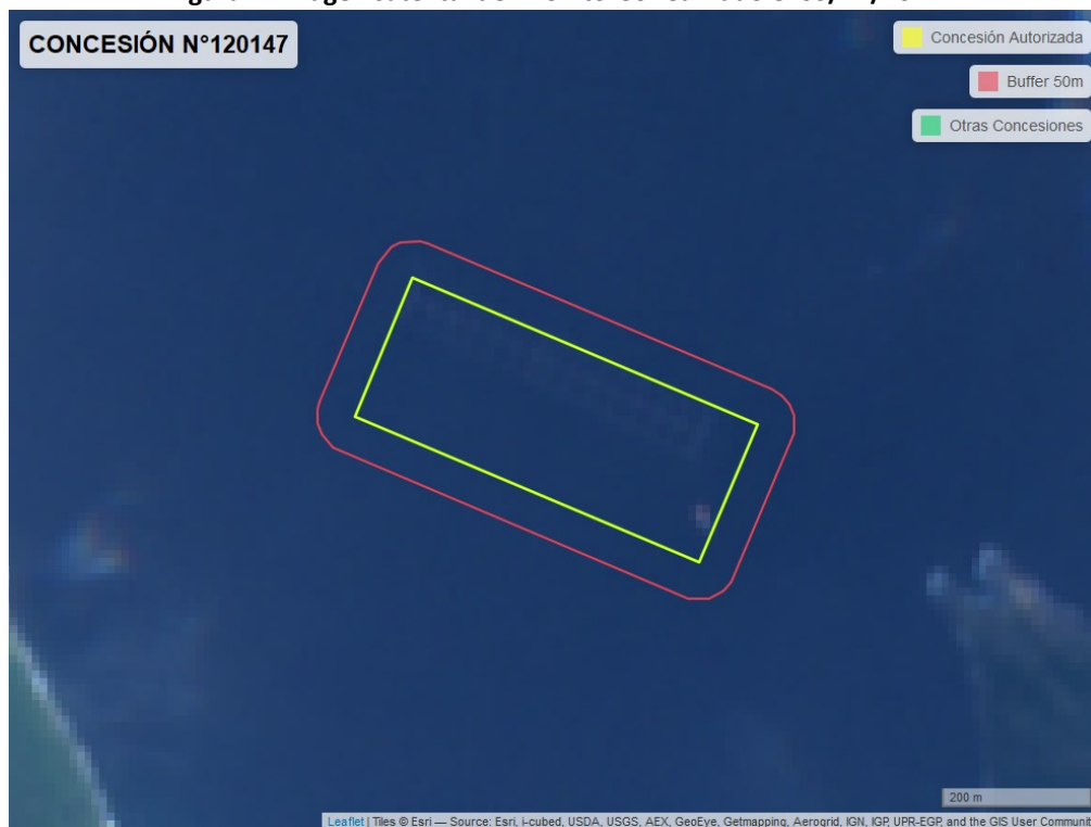
Figura 2. Imagen satelital del monitoreo realizado el 03/12/2022

En las siguientes figuras se muestran las imágenes analizadas para cada periodo y/o fecha: