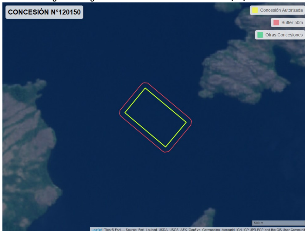
Figura 2. Imagen satelital del monitoreo realizado el 08/12/2022

En las siguientes figuras se muestran las imágenes analizadas para cada periodo y/o fecha: