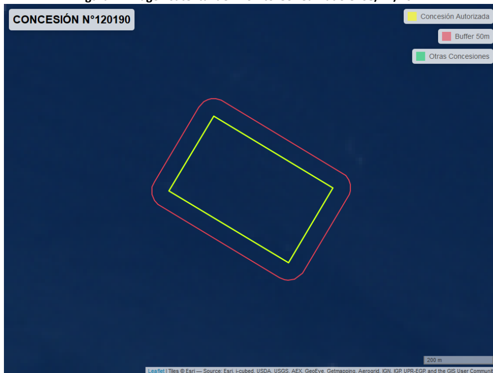
Figura 2. Imagen satelital del monitoreo realizado el 08/12/2022

En las siguientes figuras se muestran las imágenes analizadas para cada periodo y/o fecha: