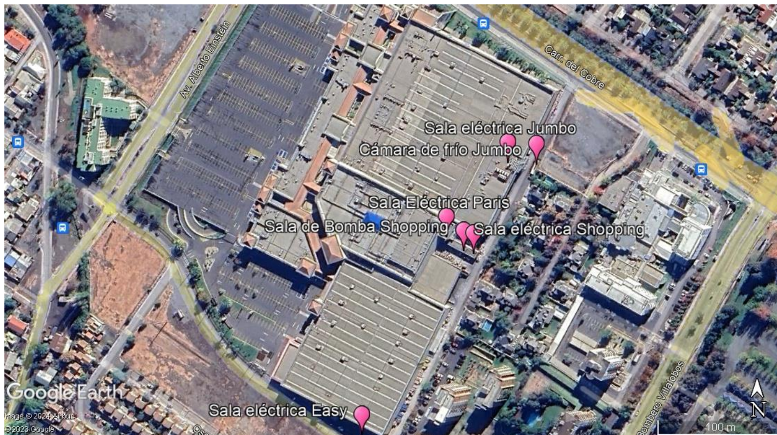
Figura 1. Distribución de fuentes de ruido ubicadas al interior de la UF.