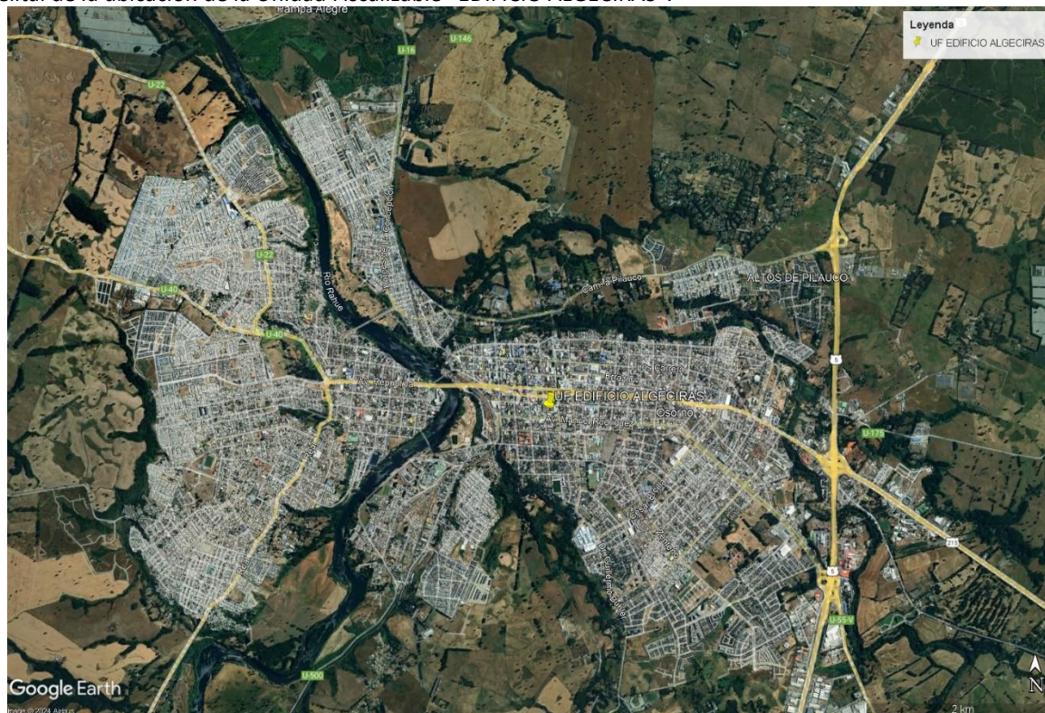
Imagen 1 Imagen satelital de la ubicación de la Unidad Fiscalizable “EDIFICIO ALGECIRAS”.