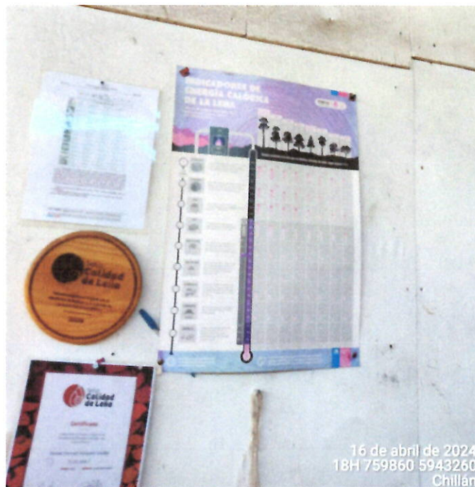
Tabla de conversión presente en el lugar de venta