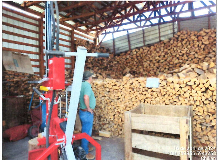
Leña dispuesta para la venta dentro de la propiedad