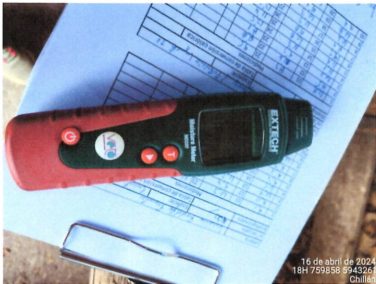
Xilohigrómetro presente en el local