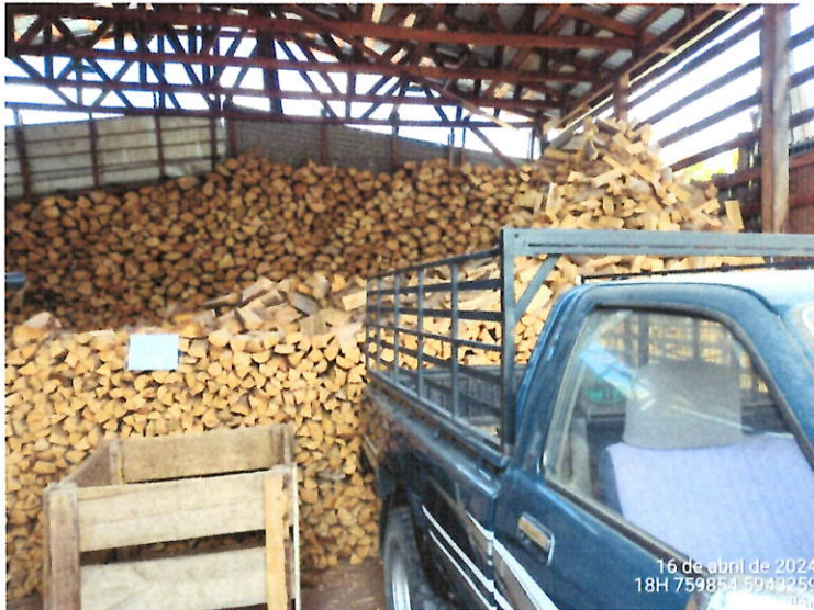
Leña dispuesta para la venta dentro de la propiedad