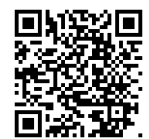
Figura 2. Descripción del medio de prueba: Plan Regulatorio Vigente comuna de Providencia Fuente: https://providencia.cl/provi/site/docs/20191112/20191112162159/ol_refundida_mod_6_20230428__1_.pdf