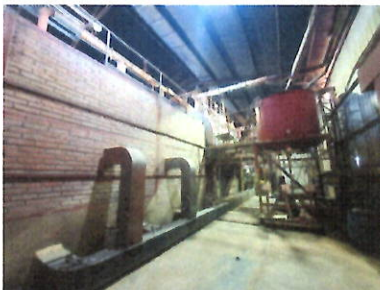
Foto 2 Placa Caldera