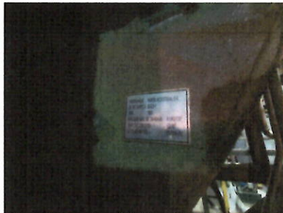
Foto 3 Chimenea sin operación