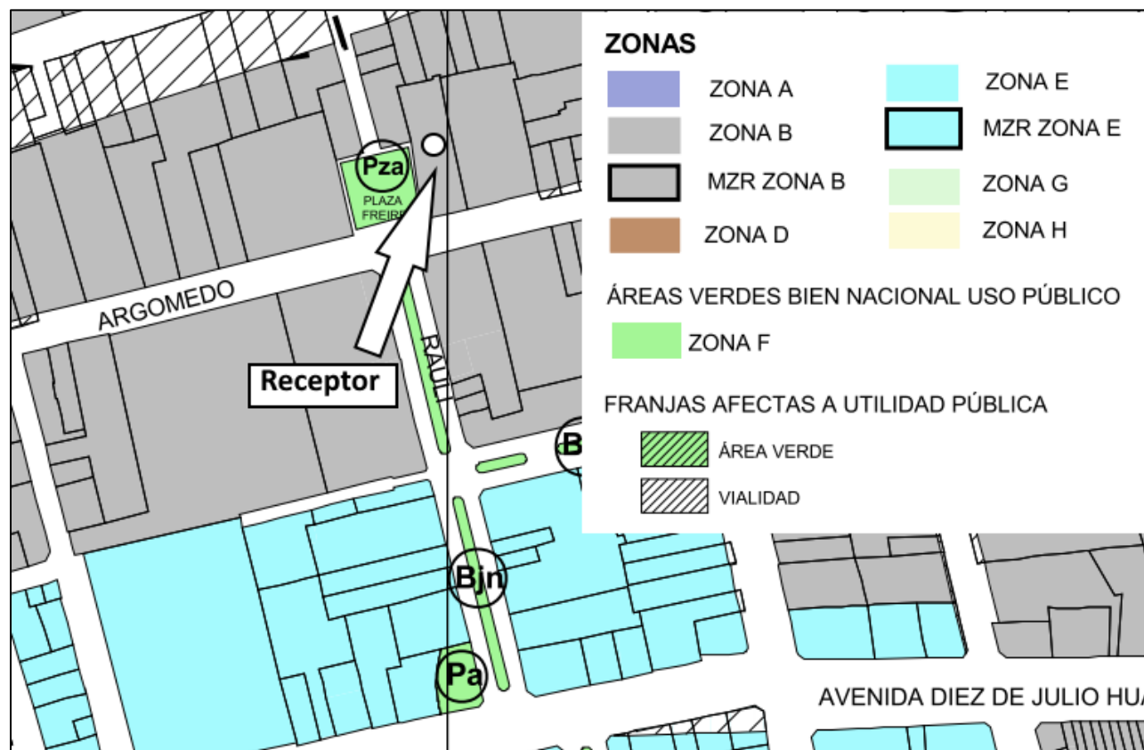
Figura 1. Plan Regulador Vigente comuna de Santiago