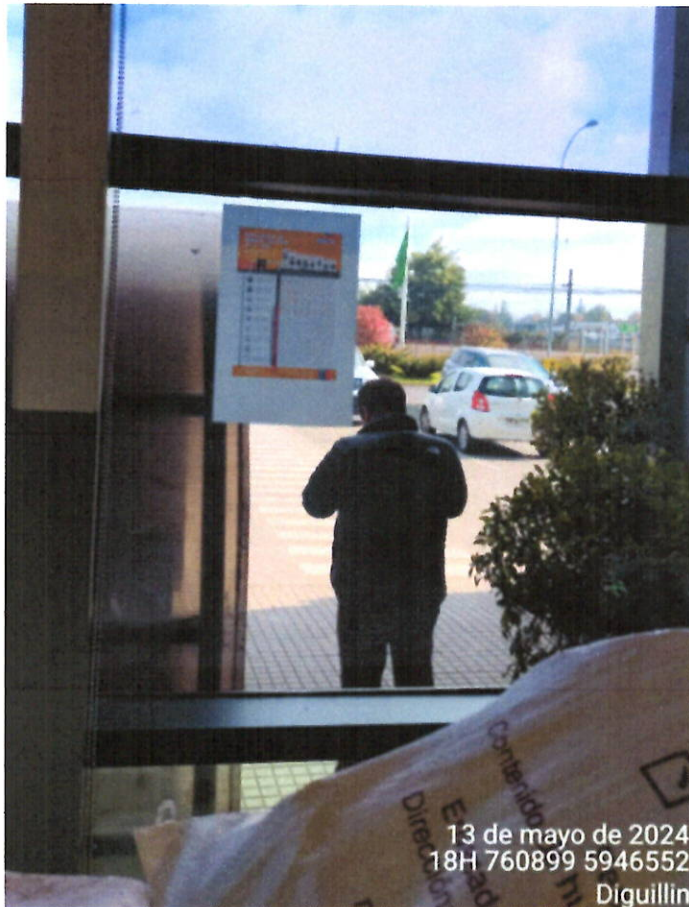
Tabla de conversión calórica presente en el local