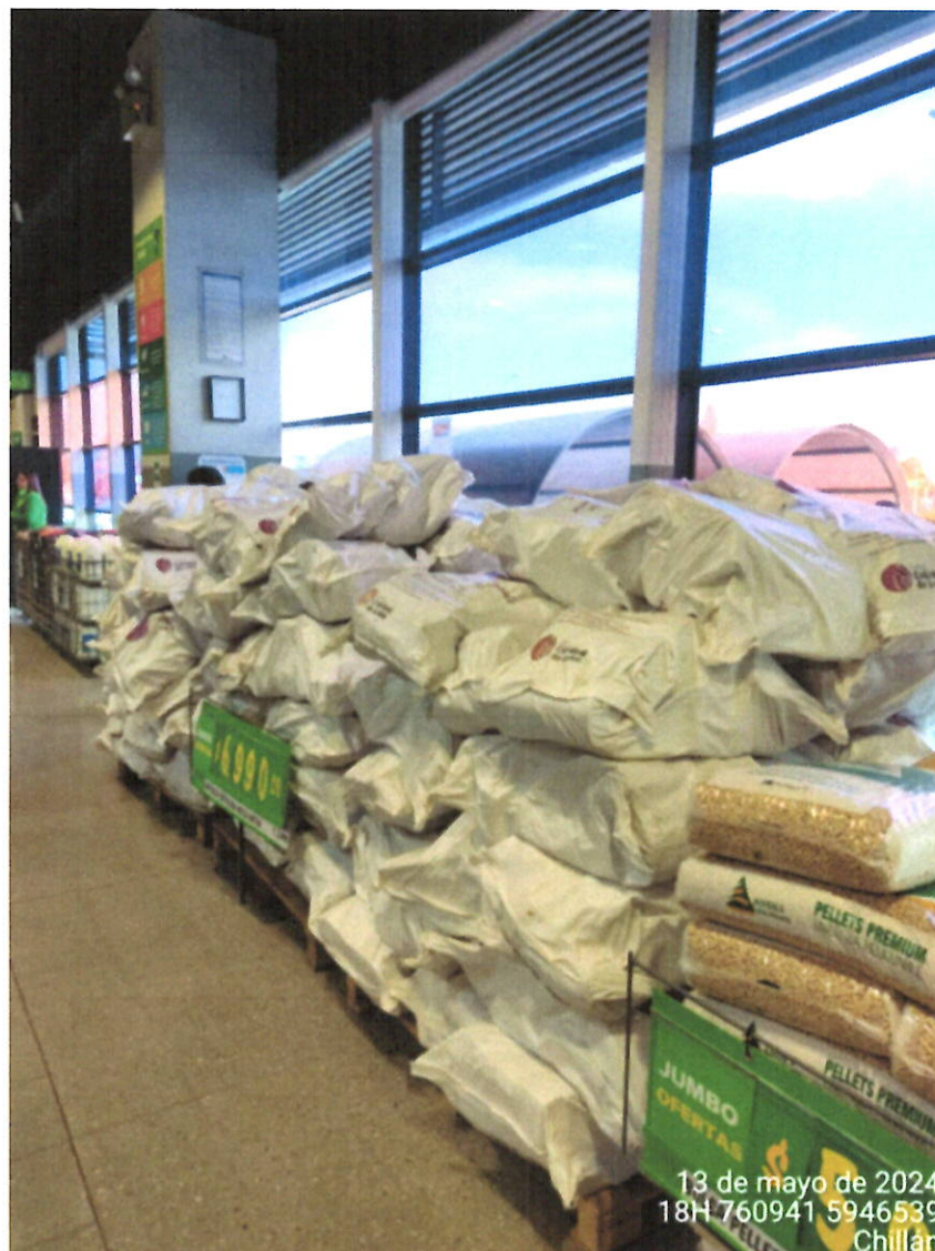
Lugar de disposición de la leña para la venta