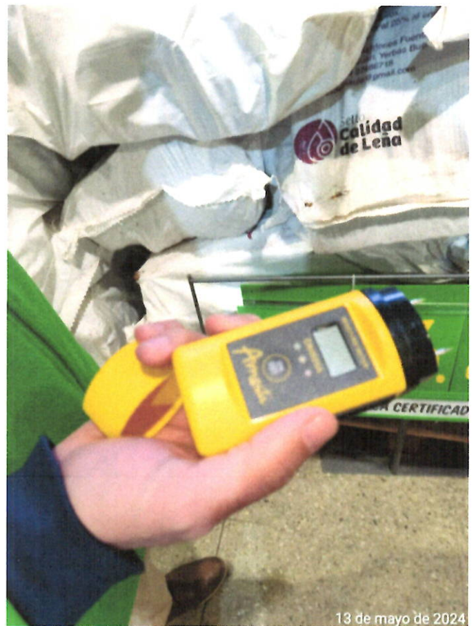
Xilohigrómetro presente en el local