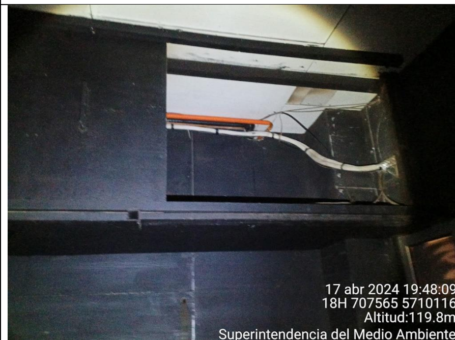
Imagen 2. Instalación de equipo de cámara de frío, ubicado en un segundo nivel y en el interior de un compartimento con aislación acústica.

Imagen 1. Lugar donde antiguamente se ubicaba el equipo de cámara de frío, considerado como fuente emisora de ruidos. En la imagen se observa un espacio vacío, sin el equipo condensador o compresor.