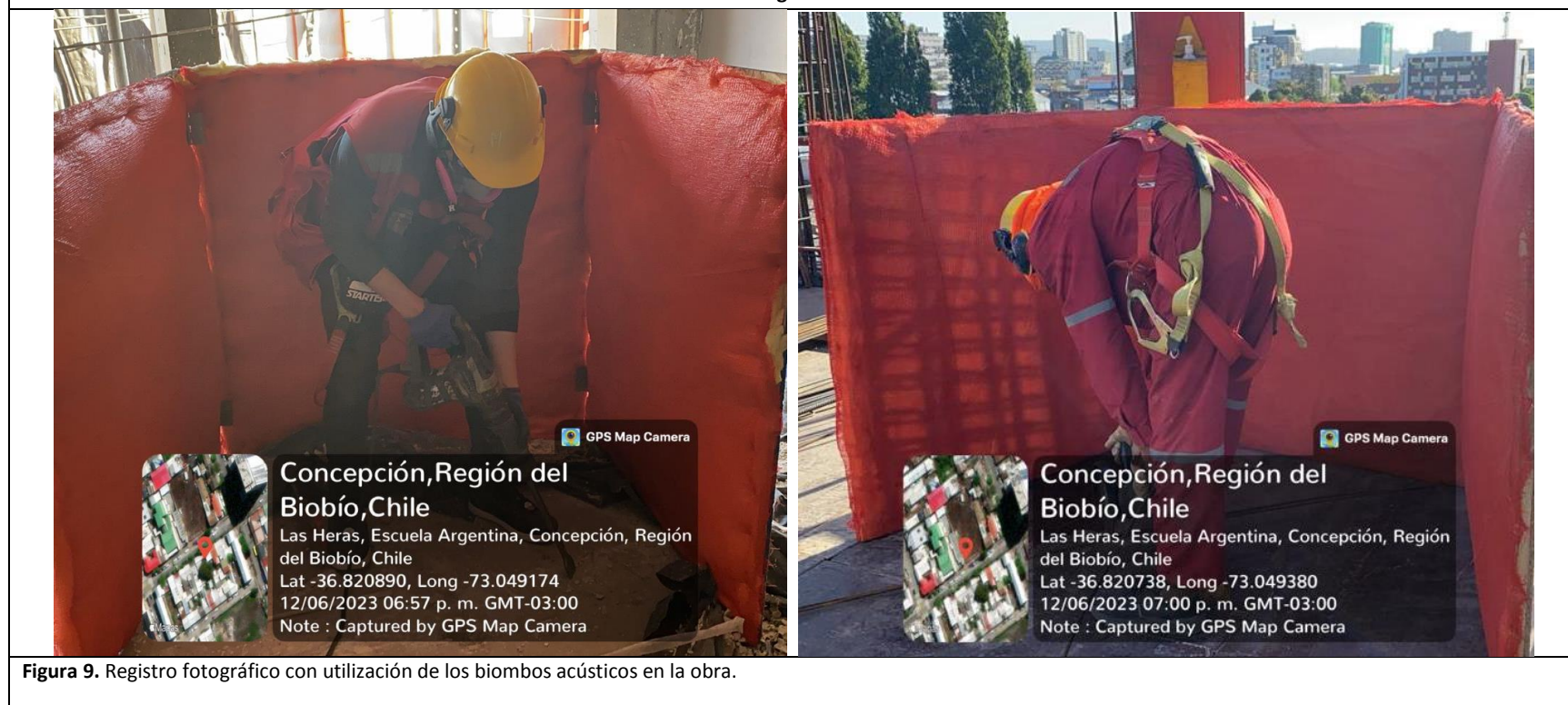
Figura 9. Registro fotográfico con utilización de los biombos acústicos en la obra.