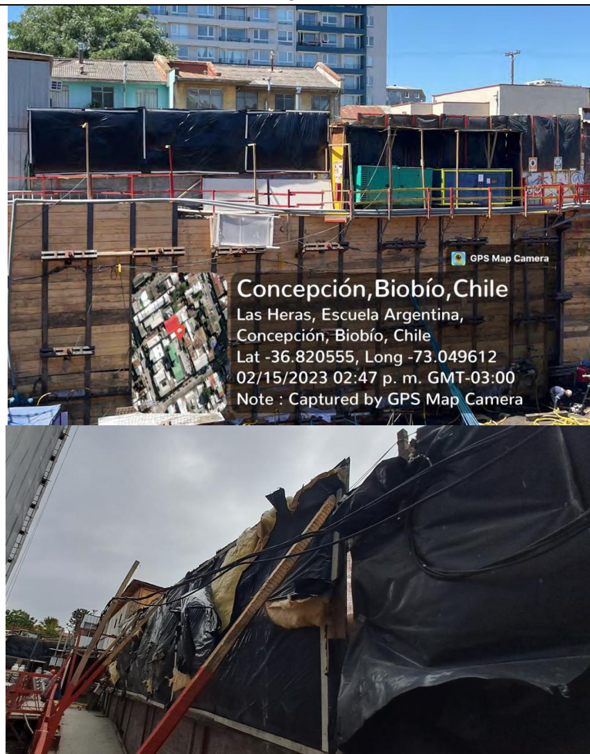
Figura 4. Registro fotográfico con la instalación de las barreras acústicas de la obra.