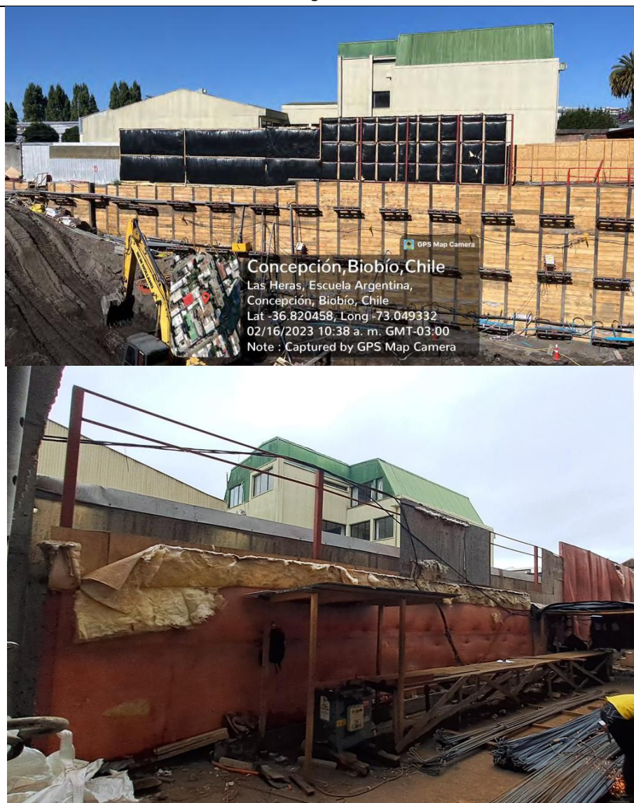
Figura 2. Registro fotográfico con la instalación de las barreras acústicas de la obra con fecha 16.02.2023 y 16.04.2024.