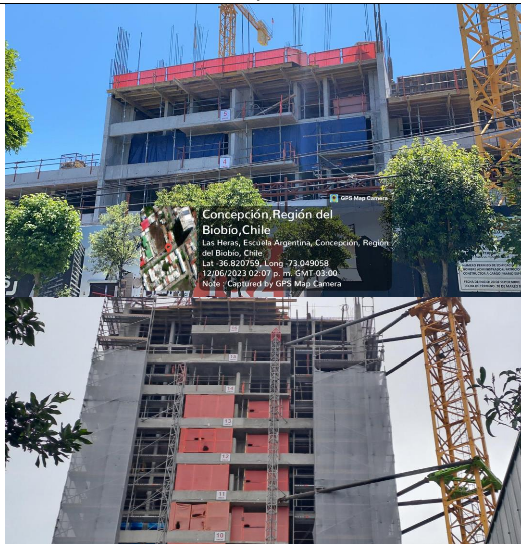
Figura 5. Registro fotográfico con la instalación de las barreras acústicas flexibles de la obra de fecha 12.06.2023 y de la obra durante la inspección de fecha 16.04.2024 sin las barreras flexibles instaladas.