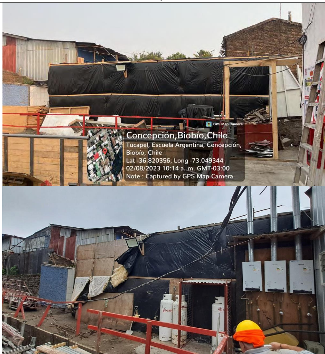
Figura 3. Registro fotográfico con la instalación de las barreras acústicas de la obra con fecha 16.02.2023 y 16.04.2024.