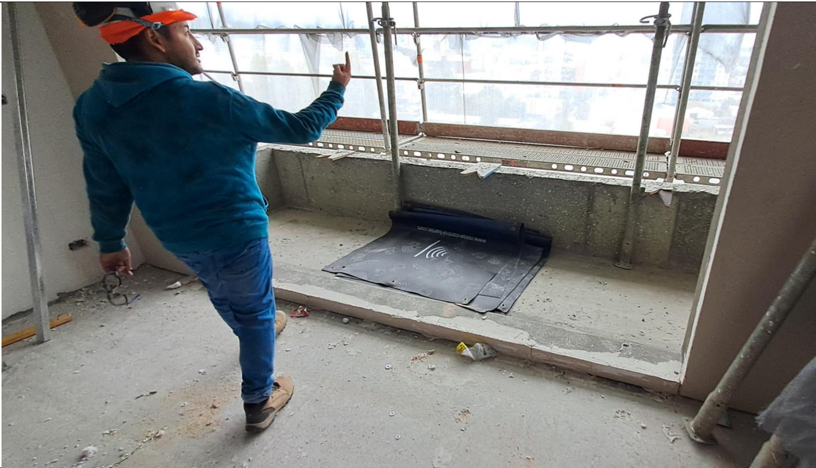
Figura 7. Registro fotográfico con las barreras acústicas de la obra en el piso 11 de la obra en el piso.