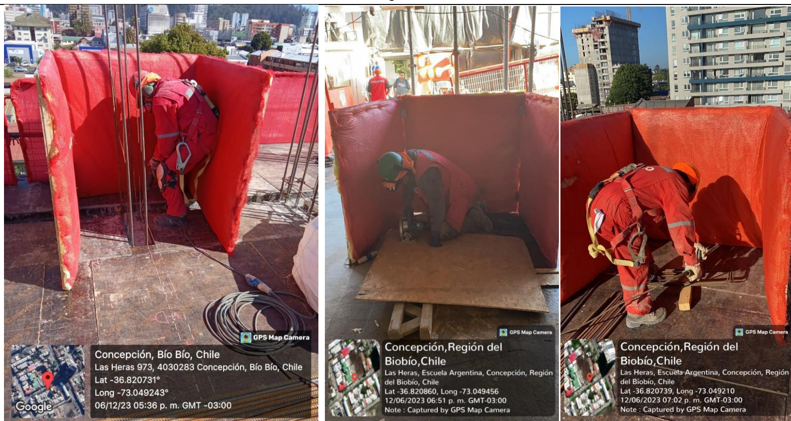
Figura 8. Registro fotográfico con utilización de los biombos acústicos en la obra.