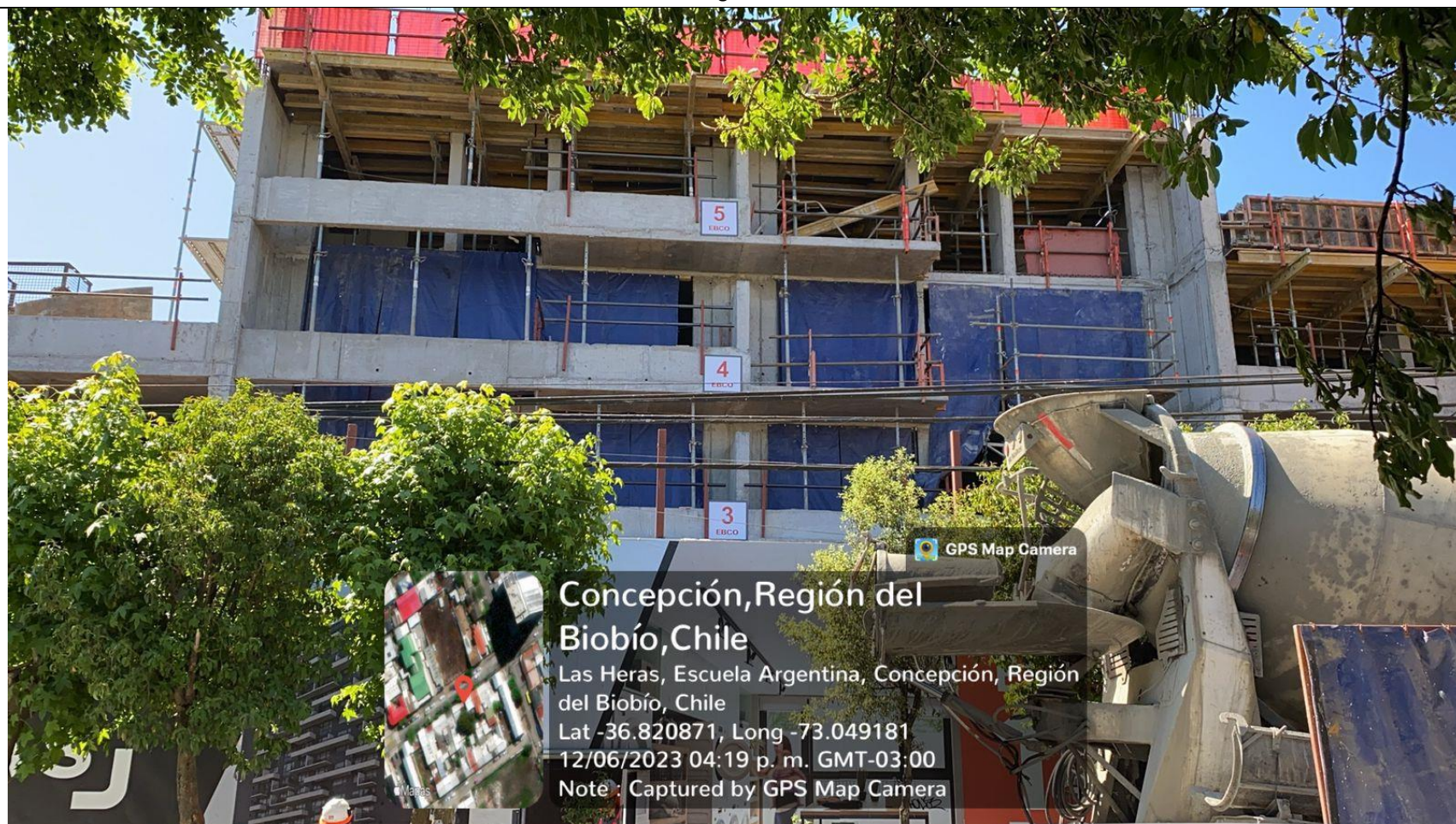
Figura 6. Registro fotográfico con la instalación de las barreras acústicas de la obra.