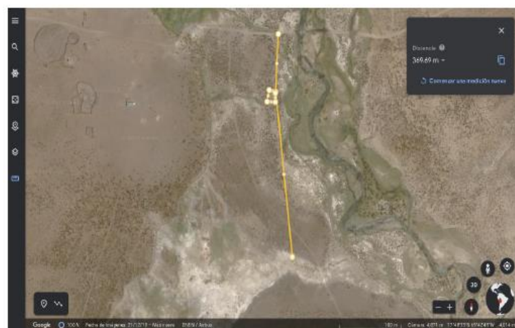
Imagen 1.