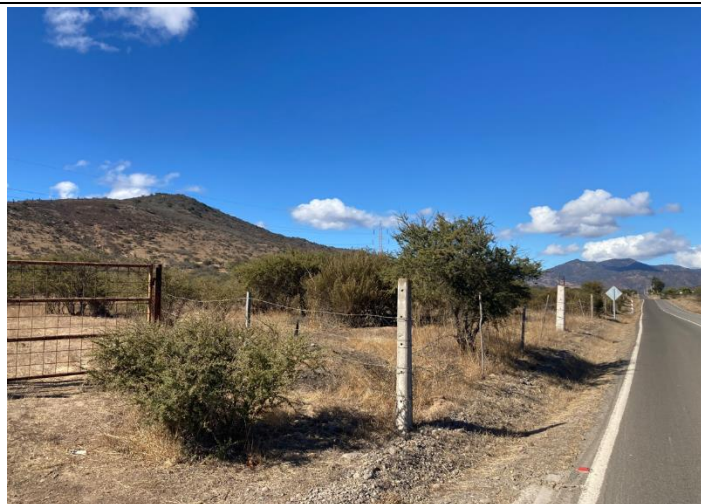
Fotografía N°1 Fecha: 30 de abril de 2024 Coordenadas UTM, WGS84, Huso 19 Norte: 6.398.548 m. Este: 288.033 m. Descripción del medio de prueba: Límite nor oriente del predio donde se proyectó la ejecución del proyecto.