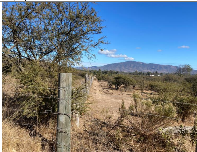
Fotografía N°3 Fecha: 30 de abril de 2024 Coordenadas UTM, WGS84, Huso 19 Norte: 6.397.677 m. Este: 288.088 m. Descripción del medio de prueba: Límite sur poniente del predio donde se proyectó la ejecución del proyecto.