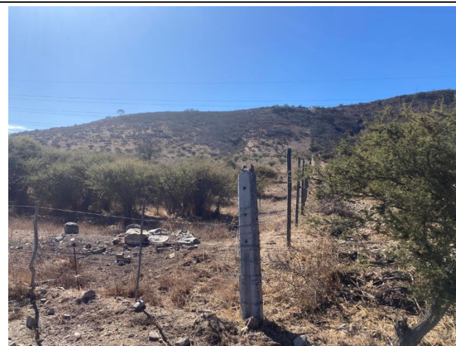
Fotografía N°2 Fecha: 30 de abril de 2024 Coordenadas UTM, WGS84, Huso 19 Norte: 6.397.678 m. Este: 288.098 m. Descripción del medio de prueba: Límite sur oriente del predio donde se proyectó la ejecución del proyecto.