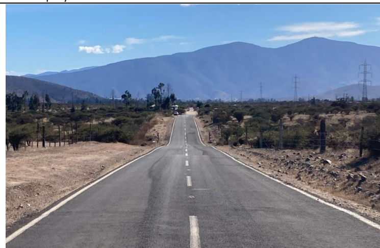
Fotografía N°4 Fecha: 30 de abril de 2024 Coordenadas UTM, WGS84, Huso 19 Norte: 6.398.036 m. Este: 288.068 m. Descripción del medio de prueba: Vista de sur a norte del área del proyecto, donde se aprecian las áreas oriente y poniente.