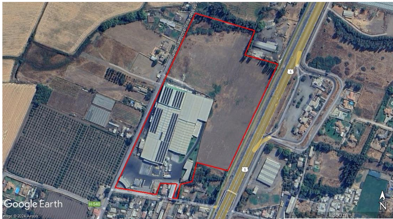
Figura 1. Predio en donde opera la UF