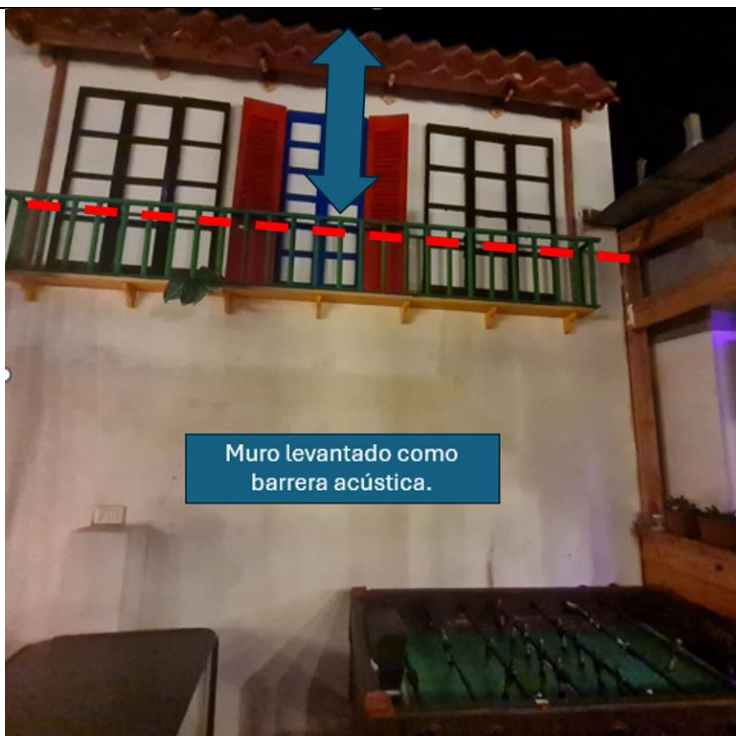
Fotografía N° 1

Descripción del registro: Muro de material sólido en lado sur del perímetro de la terraza de la UF.