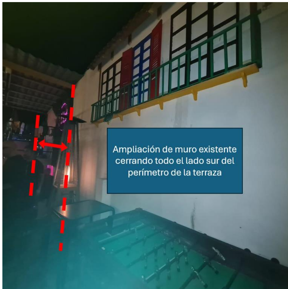
Fotografía N° 2:

Descripción del registro: Restaurant Mitad del Mundo. Ampliación del muro existente en lado sur del perímetro de la terraza de la UF.