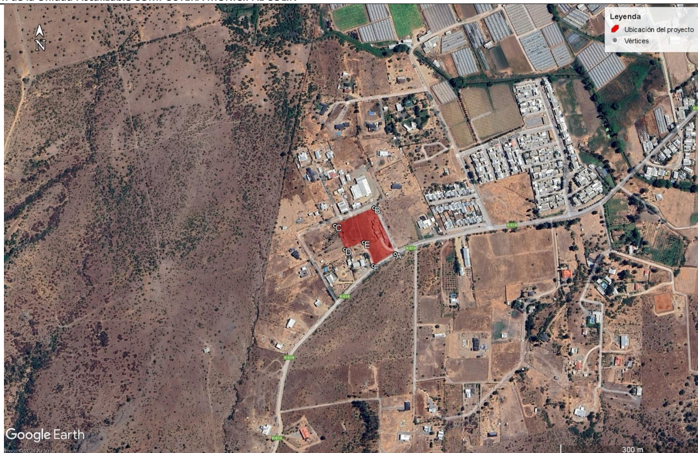
Figura 2: Ubicación de la Unidad Fiscalizable COMPOSTERA MUNICIPAL COLIN