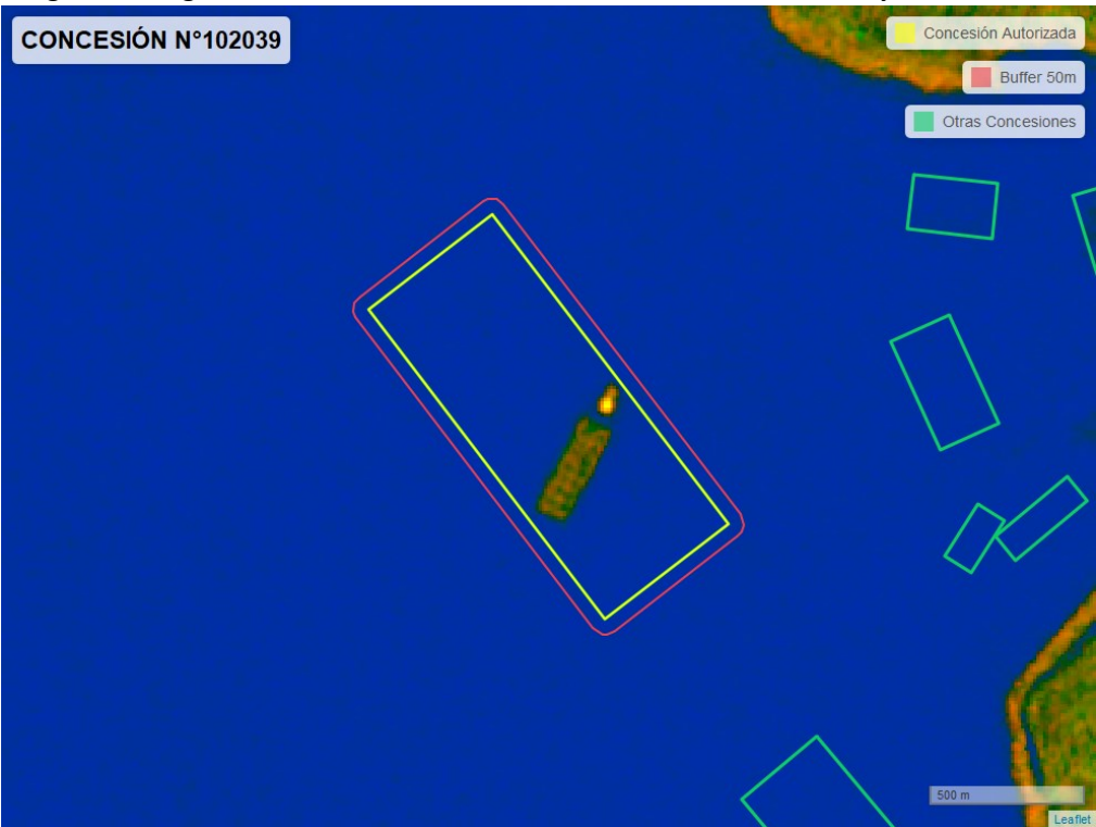
Figura 2. Imagen satelital del monitoreo realizado entre el 01/01/2024 y el 29/02/2024

En las siguientes figuras se muestran las imágenes analizadas para cada periodo y/o fecha: