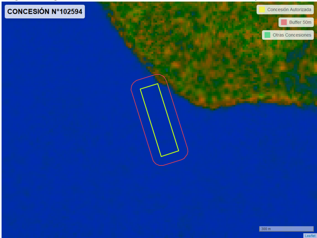
Figura 2. Imagen satelital del monitoreo realizado entre el 01/01/2024 y el 29/02/2024

En las siguientes figuras se muestran las imágenes analizadas para cada periodo y/o fecha: