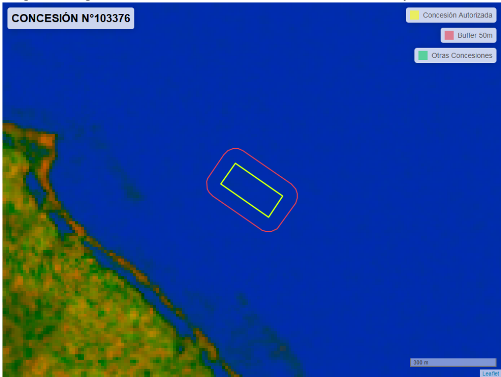
Figura 2. Imagen satelital del monitoreo realizado entre el 01/01/2024 y el 29/02/2024

En las siguientes figuras se muestran las imágenes analizadas para cada periodo y/o fecha: