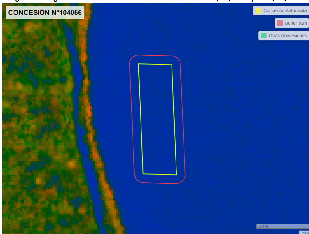
Figura 2. Imagen satelital del monitoreo realizado entre el 01/01/2024 y el 29/02/2024

En las siguientes figuras se muestran las imágenes analizadas para cada periodo y/o fecha: