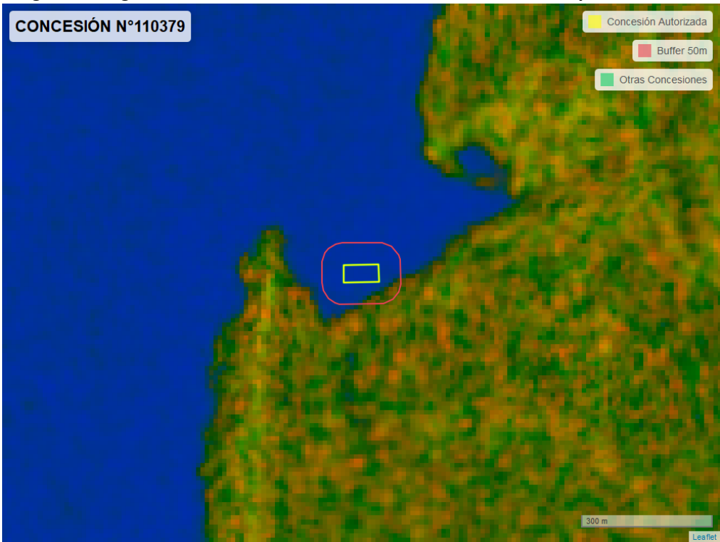
Figura 2. Imagen satelital del monitoreo realizado entre el 01/01/2024 y el 29/02/2024

En las siguientes figuras se muestran las imágenes analizadas para cada periodo y/o fecha: