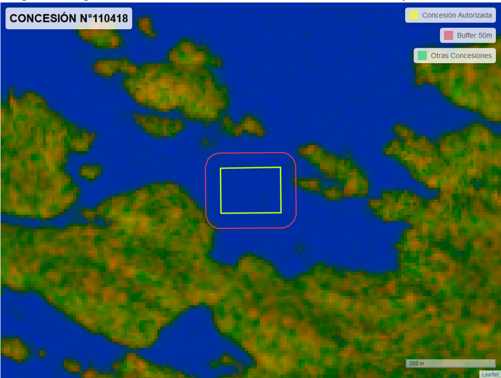
Figura 2. Imagen satelital del monitoreo realizado entre el 01/01/2024 y el 29/02/2024

En las siguientes figuras se muestran las imágenes analizadas para cada periodo y/o fecha: