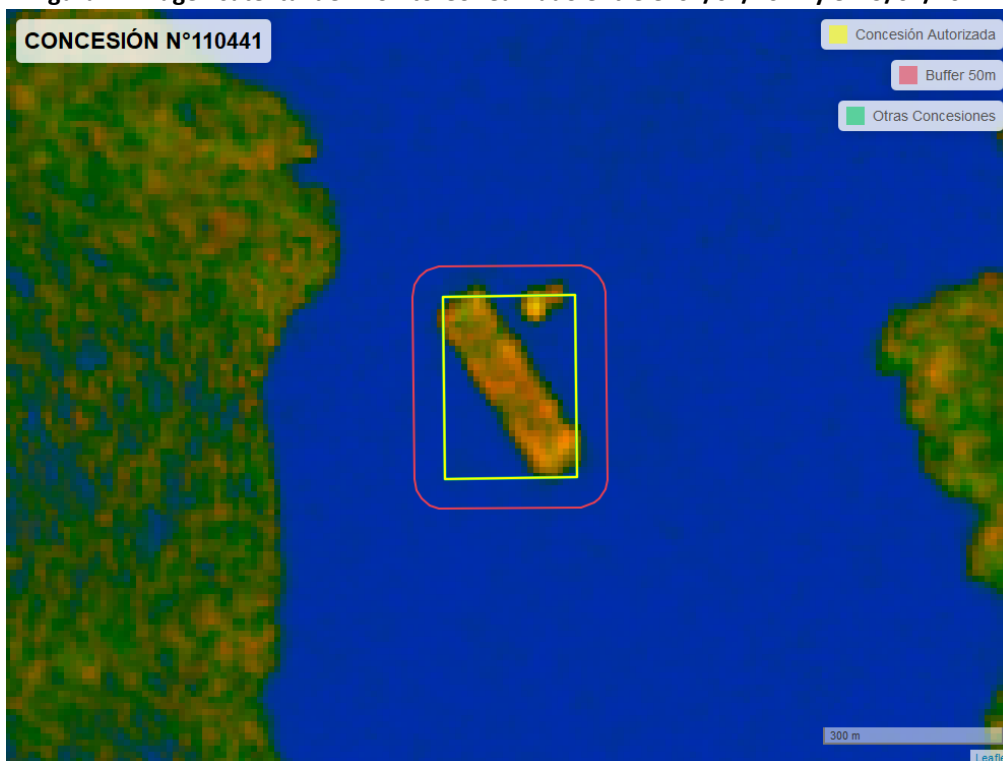
Figura 2. Imagen satelital del monitoreo realizado entre el 01/01/2024 y el 29/02/2024

En las siguientes figuras se muestran las imágenes analizadas para cada periodo y/o fecha: