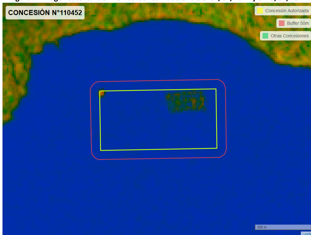
Figura 2. Imagen satelital del monitoreo realizado entre el 01/01/2024 y el 29/02/2024

En las siguientes figuras se muestran las imágenes analizadas para cada periodo y/o fecha: