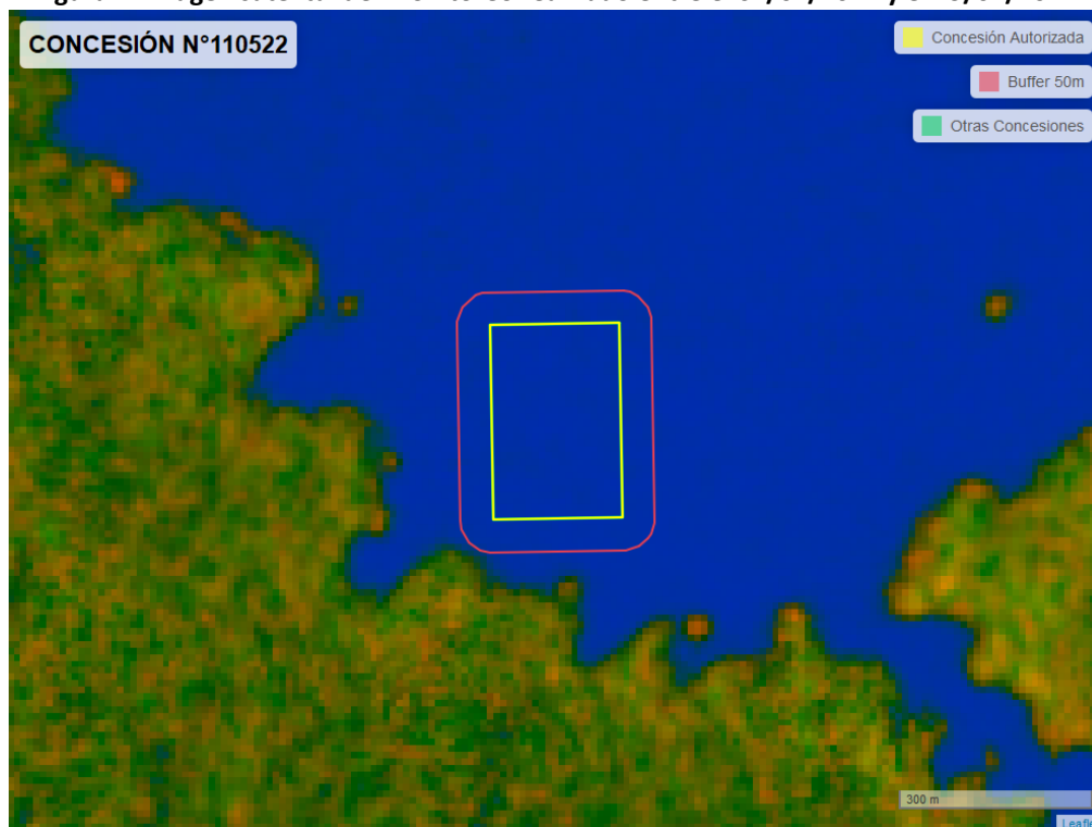
Figura 2. Imagen satelital del monitoreo realizado entre el 01/01/2024 y el 29/02/2024

En las siguientes figuras se muestran las imágenes analizadas para cada periodo y/o fecha: