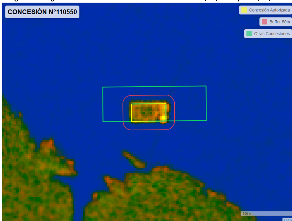
Figura 2. Imagen satelital del monitoreo realizado entre el 01/01/2024 y el 29/02/2024

En las siguientes figuras se muestran las imágenes analizadas para cada periodo y/o fecha: