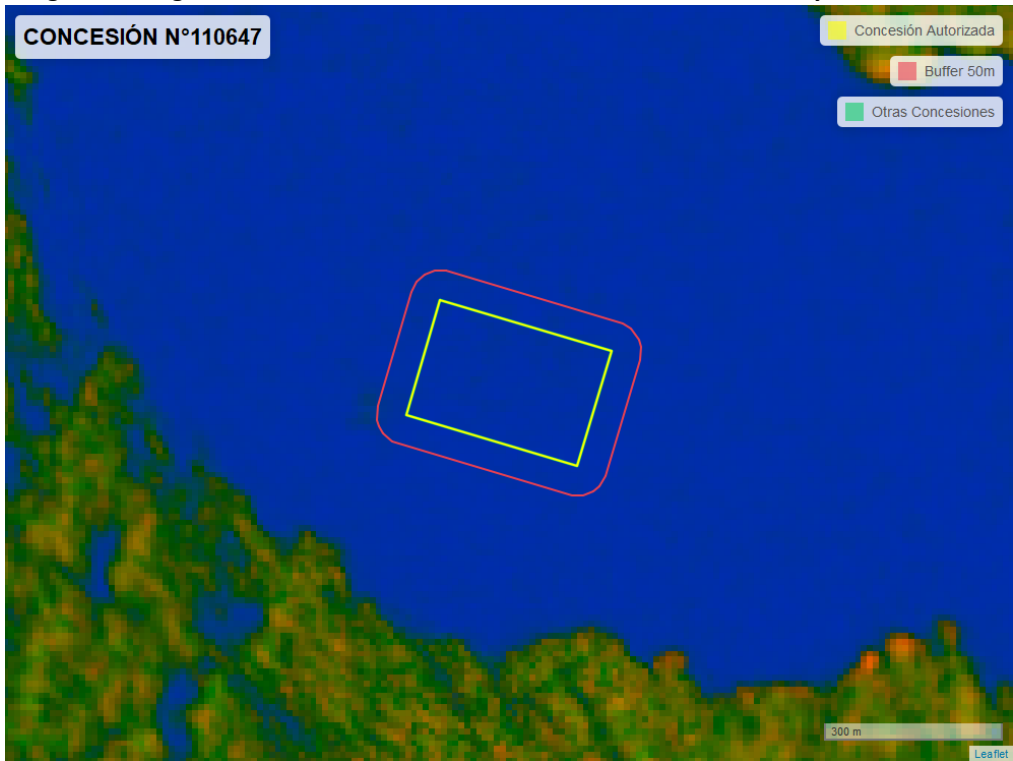
Figura 2. Imagen satelital del monitoreo realizado entre el 01/01/2024 y el 29/02/2024

En las siguientes figuras se muestran las imágenes analizadas para cada periodo y/o fecha: