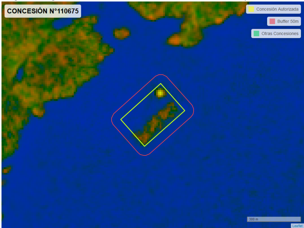
Figura 2. Imagen satelital del monitoreo realizado entre el 01/01/2024 y el 29/02/2024

En las siguientes figuras se muestran las imágenes analizadas para cada periodo y/o fecha: