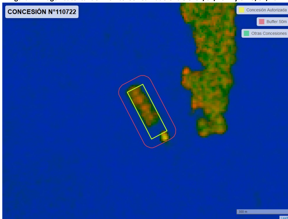
Figura 2. Imagen satelital del monitoreo realizado entre el 01/01/2024 y el 29/02/2024

En las siguientes figuras se muestran las imágenes analizadas para cada periodo y/o fecha: