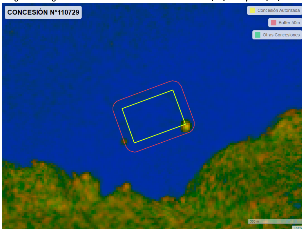
Figura 2. Imagen satelital del monitoreo realizado entre el 01/01/2024 y el 29/02/2024

En las siguientes figuras se muestran las imágenes analizadas para cada periodo y/o fecha: