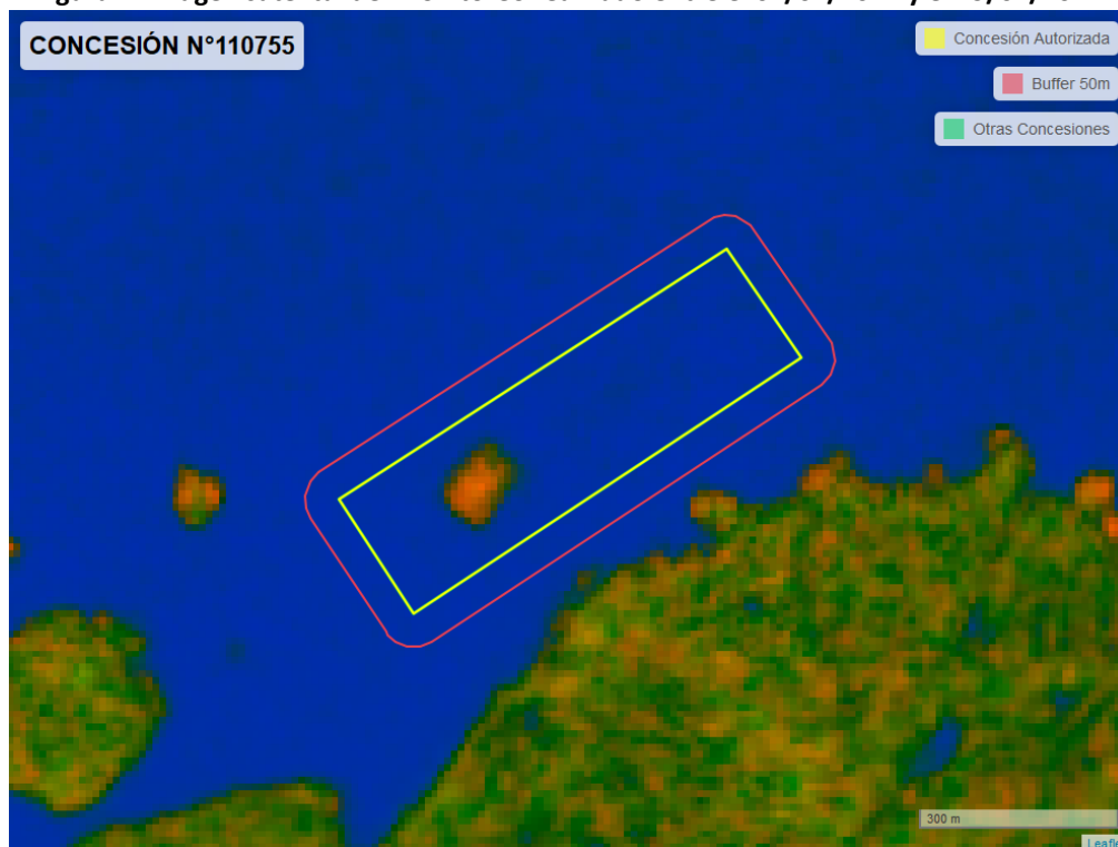
Figura 2. Imagen satelital del monitoreo realizado entre el 01/01/2024 y el 29/02/2024

En las siguientes figuras se muestran las imágenes analizadas para cada periodo y/o fecha: