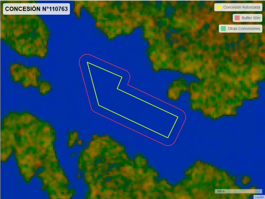
Figura 2. Imagen satelital del monitoreo realizado entre el 01/01/2024 y el 29/02/2024

En las siguientes figuras se muestran las imágenes analizadas para cada periodo y/o fecha: