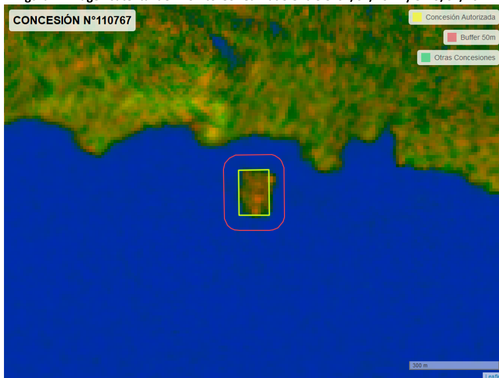
Figura 2. Imagen satelital del monitoreo realizado entre el 01/01/2024 y el 29/02/2024

En las siguientes figuras se muestran las imágenes analizadas para cada periodo y/o fecha: