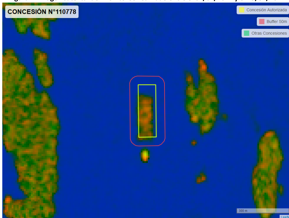
Figura 2. Imagen satelital del monitoreo realizado entre el 01/01/2024 y el 29/02/2024

En las siguientes figuras se muestran las imágenes analizadas para cada periodo y/o fecha: