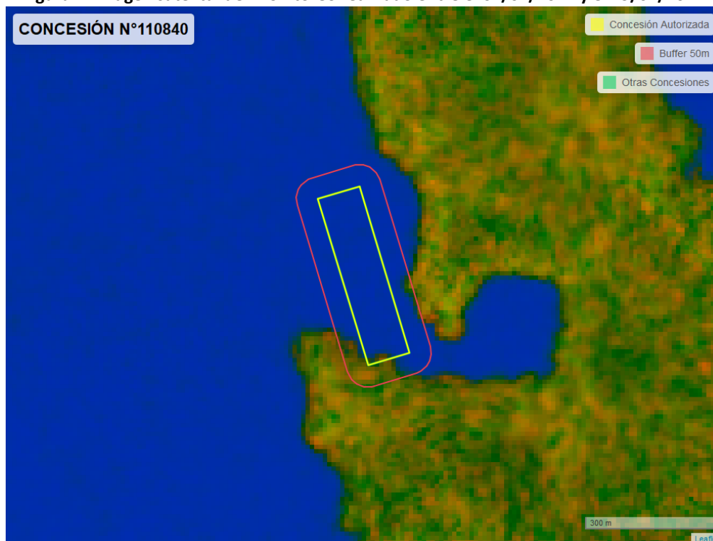
Figura 2. Imagen satelital del monitoreo realizado entre el 01/01/2024 y el 29/02/2024

En las siguientes figuras se muestran las imágenes analizadas para cada periodo y/o fecha: